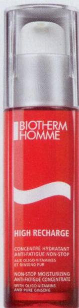
Biotherm Homme High Recharge Energy Shot. 32,10 euros le flacon-pompe de 125 ml.