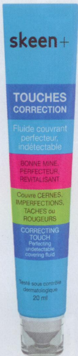
Skeen+ Touches Correction. 29 euros le tube de 20 ml.